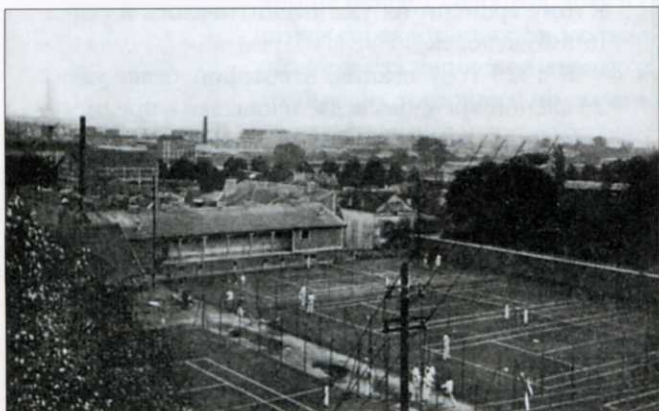
На площадках Русского лаун-теннис клуба в Париже (1930)

Благодаря усилиям отдельных лиц и вниманию со стороны зарубежной прессы, жизнь в клубе