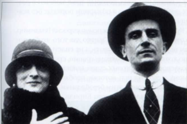
Феликс и Ирина Юсуповы – законодатели парижской моды. Начало 1920-х годов